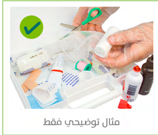
مثال توضيحي فقط