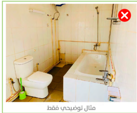
مثال توضيحي فقط