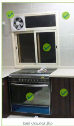
مثال لتوضيح فقط