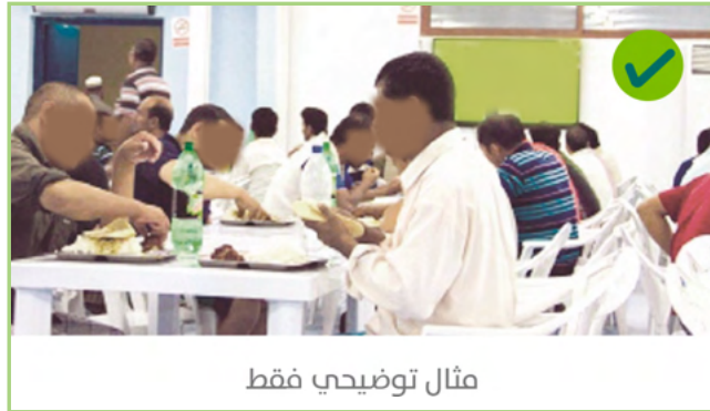
مثال توضيحي فقط